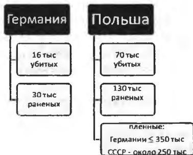
Схема 2. Потери за время германо-польской войны:

Общее состояние польских войск оказалось катастрофическим, погибло около 70 воинов, приблизительно 140 тыс. было ранено, в германский плен попало более 350 тыс. человек (из них 40 тыс. назвались белорусами). Значительные потери понесла и Германия – более 16 тыс. раненых и около 30 тыс. убитых (см. схему 2). В результате больших потерь германских вооружённых сил начало наступления на Францию было надолго задержано.